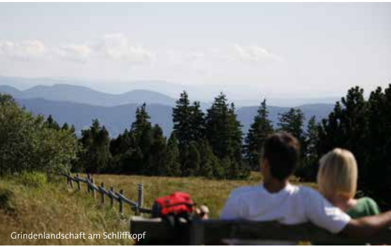
Gründenlandschaft am Schliffkopf